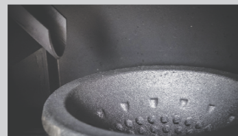
ložište gorionika-izrađeno od kvalitetnog sivog liva