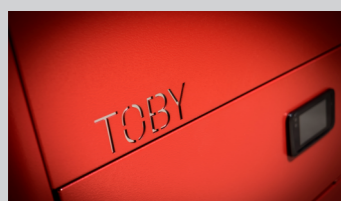
savremen dizajn i moderan izgled kotla

Unutrašnji kazan kotla je sačinjen od čeličnog kotlovskog lima debljine 5 milimetara, dok su ostale stranice kotla koje nisu u kontaktu sa vatrom, debljine 4 milimetra.