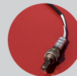
lambda sonda kontroliše količinu kiseonika u ložištu i omogućava optimalno sagorevanje (opciono)

Kotao TOBY ispunjava najstrožije ekološke zahteve kad su u pitanju emisije štetnih čestica. Sve emisione vrednosti su u okviru referentnih vrednosti na nivou Evropske unije te ispunjava uslove za subvencionisanje od strane pojedinih država i regija.