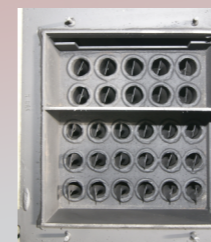
cevni izmenjivač sa mehanizmom za čišćenje