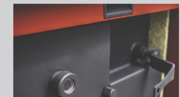
mehanizam za čišćenje cevog izmenjivača