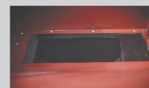
prostrani bunker omogućuje autonomiju u radu kotla