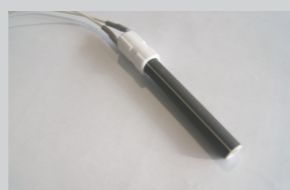
keramički grejač, omogućuje brzo i sigurno potpaljivanje peleta