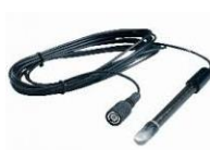
Redox - 36005