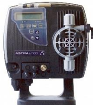
Optima pH i Re